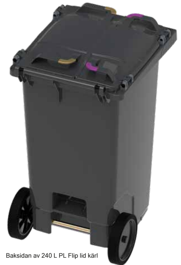
Baksidan av 240 L PL Flip lid kärll

För att säkerställa tillgänglighet för personer med nedsatt syn kan clipsen tillverkas med upphöjd taktill text, vilket underlättar identifieringen med känseln.