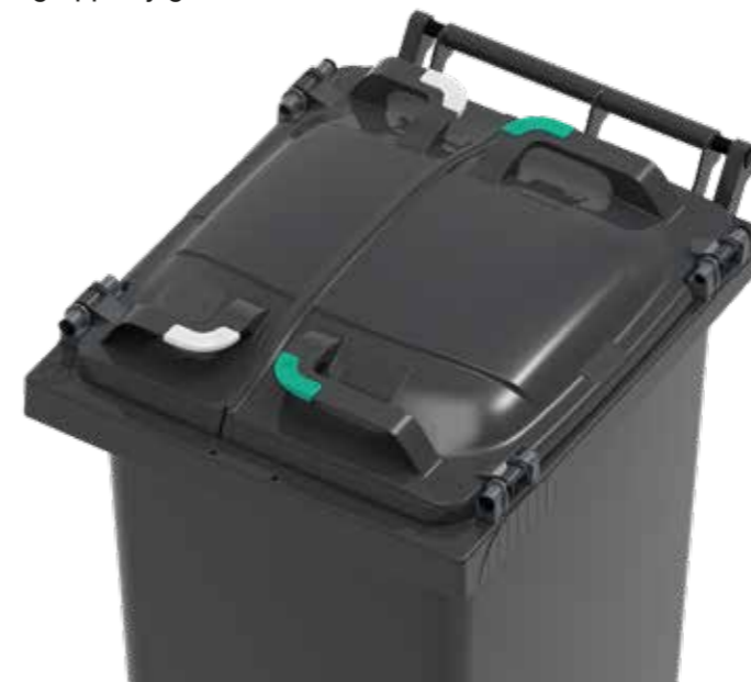
Flip lid monterat med clips

Med ett avstånd på över 50 mm mellan handtag och kärlekropp ger generösa greppmöjligheter.