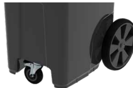
Framhjul och 310 mm hjul

Ett integrerat fotsteg och tillval med framhjul och stora 310 mm hjul gör manövreringen av kärlet ännu enklare och mer flexibel, även när det är fullastad.